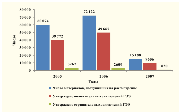
Рис. 6. Динамика поступления материалов и утверждения ГЭЭ в целом по Ростехнадзору в 2005–2007 гг.

Из всех представленных на ГЭЭ материалов доля отказов в ее проведении составляет, %: в центральном аппарате – 20; в территориальных органах – 18; доля отрицательных заключений: соответственно 9 и 8.