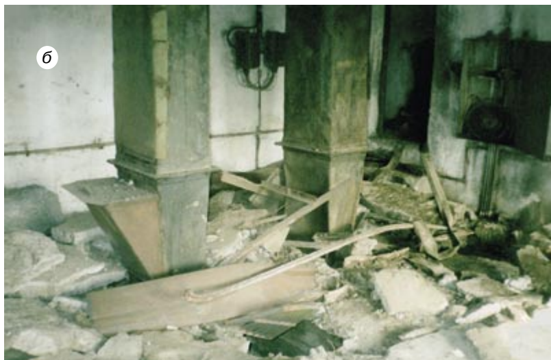
Рис. 1, а и б. Разрушения строительных конструкций в результате взрыва пылевоздушной смеси в элеваторе ООО «Татарскзернопродукт»