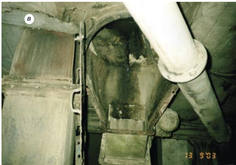
Рис. 1. в. Разрушение оборудования в результате взрыва пылевоздушной смеси в элеваторе ООО «Татарскзернопродукт»

ниях с 1-го по 4-й этажи рабочего здания, подсилованных этажей силосных корпусов и лестничной клетки, выбиты несколько оконных рам, частично разрушены перекрытия галереи приемного устройства с железной дороги и на 3-м этаже рабочего здания (рис. 1, а–в). Пострадали два человека.